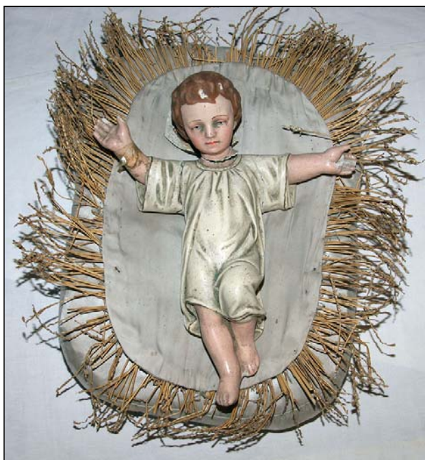
A kis Jézus (endrődi templom)

Az első karácsony óta mi emberek, istenképmások, rokonai lettünk az Istennek: „Aki teljesíti mennyei Atyám akaratát, az mind testvérem, nővérem és anyám.” (Márk 3,35)