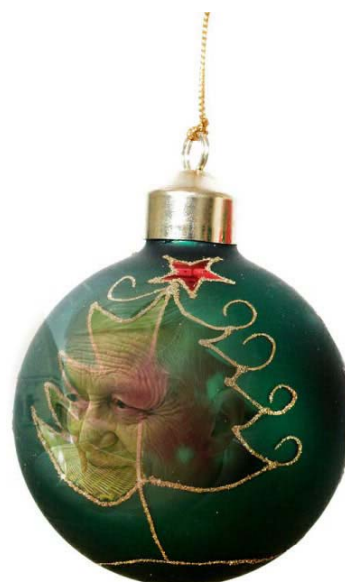
ROGER TESTVÉR, (TAIZEI szerzetesközösség alapítójának imája)

Krisztus, Te ránk hagytad, újra meg újra ránk bízod a szót: Isten megbocsátásának, az emberbe vetett bizalmának ígéjét. Hogy követni tudjunk, erőt adsz a szüntelen újrakezdéshez. Követni téged életünk hétköznapi eseményei közepette: ez csak abból áll, hogy rátalálunk az útra - nem a merev törvények ösvényére - hanem terád, Krisztus, aki valóban út vagy: rajtad keresztül maga Isten siet felénk.