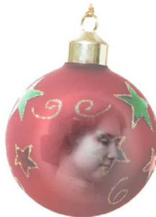
HELEN KELLER IMÁJA (az első siket- vak író, aki főiskolai diplomat szerzett)

Hiszem, hogy az életet azért kaptuk, hogy növekedjünk a szeretetben. Hiszem Istenem, hogy bennem vagy, miként a nap a fényben, és az illat a virágban. Fény a sötétben! Hang az én csöndemben!