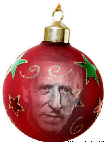
Teilhard de Chardin (francia jezsuita teológus, filozófus, paleontológus)