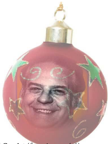
Michel Quoist (francia pap, író)