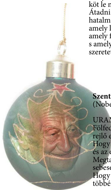
Szent-Györgyi Albert (Nobel-díjas orvos, biokémikus)

Milyen jó, hogy rábízhatjuk kezünket arra a Kézre, amely megtörte és életre keltette a Kenyeret, amely megáldotta és megsimogatta a gyermekeket, s amelyet szegek vertek át. Ráhagyatkozni arra a Kézre, amely olyan, mint a miénk, de amelynek tetszőleges döntését csupa jóság vezérli s folyton csak szorosabban köt le minket önmaga számára. Átadni magunkat annak a puha és hatalmas erejű Kéznek, amely lehat a lélek velejéig, amely formál és teremt, s amelyen át oly végtelen szeretet árad.